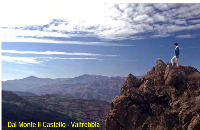
Dal Monte Il Castello - Valtrebbia