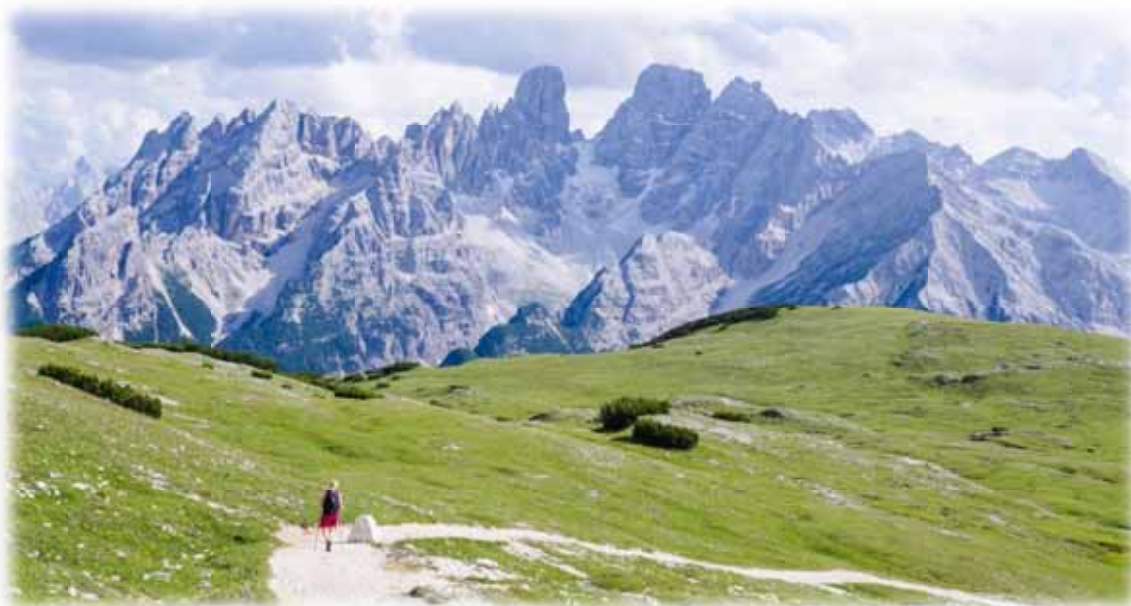
Il gruppo del Cristallo scendendo dal Rifugio Vallandro.

GRUPPO B: Monte Specie (E): Il sentiero 18A inizia al di là della strada, si inoltra lungo il greto del torrente e inizia a salire nel bosco. La valle va restringendosi con belle vedute sulla vicina Croda Rossa e alle spalle il gruppo del Cristallo. Nell'ultimo tratto, in vista di una alta cascata, la mulattiera, alta sul torrente, è lavorata con scalini in legno. Si esce a una selletta, punto di incrocio di vari sentieri (circa ore 1,10 dalla partenza, segnavia) e si prosegue verso Prato Piazza su stradiciola tra prati e caratteristici fienili in legno. Si giunge all'albergo Prato Piazza e all'omonimo rifugio a cui si può accedere in auto (v. orari) dalla località Ponticello in valle di Braies . Tra il rifugio e l'albergo si diparte il sentiero 40A che subito dopo lascia a sx la deviazione per il Picco di Vallandro . Si prosegue verso dx fino a incrociare la stradina militare che sale dal Rifugio Vallandro . La si segue con varie scorciatoie fino alla panoramica, facilissima cima del Monte Specie 2.307 m . Discesa per la stradetta di salita fino a un evidente sentiero che si stacca a sx e che porta velocemente al bel Rifugio Vallandro (apertura estiva e invernale). Per comoda strada e sentiero nel bosco segnato n. 37 , si arriva alla località Carbonin sulla SS 251 . Si ritorna a ritroso per circa km 2,2 alla località Cimabanche , punto di partenza. Si può usufruire per un tratto del tracciato della pista da fondo.