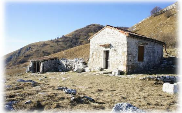
Casera Rupeit 1.275 m

Piccola sosta alla casera e riprendiamo il cammino per il sentiero 988 e poco dopo essere entrati nel bosco svolteremo a destra per una traccia che ci porterà sulla strada, attraversata la quale prenderemo la traccia contrassegnata con segnavia giallo-blu fino a riprendere l'ultimo tratto di sentiero 987 che ci condurrà al parcheggio.