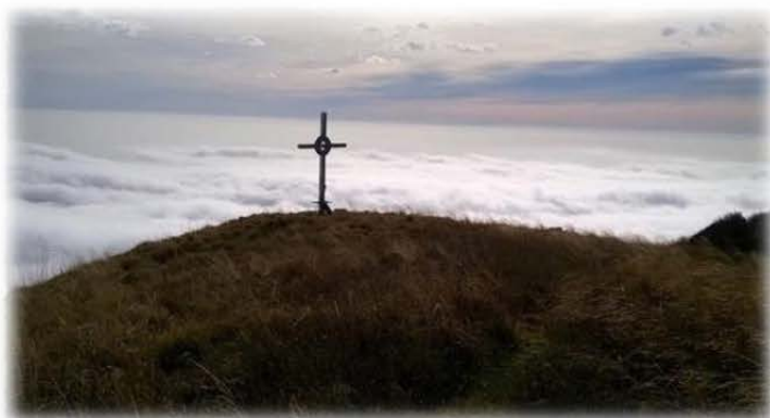
Croce di vetta

Prealpi Carniche - Gruppo del Monte Cavallo